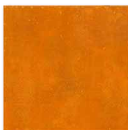
GAR3B073 PEI 3 ○ 80 / m 2

oranžová / orange / orange pomarańczowa / оранжевый / narancs