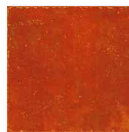
GAR3B074 PEI 3 ○ 80 / m 2

oranžová / orange / orange pomarańczowa / оранжевый / narancs