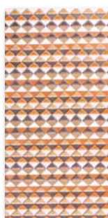
WITMB008 ○ 76 / ks

tmavě oranžová / dark orange / dunkelorange ciemnopomarańczowa / темно-оранжевый / sötétnarancs