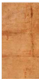
WATMB005 ○ 74 / m 2

světle žlutá / light yellow / hellgelb jasnożółta / светло-желтый / világossárga