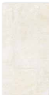
WATMB004 ○ 74 / m 2

světle žlutá / light yellow / hellgelb jasnożółta / светло-желтый / világossárga