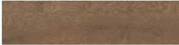
Selected oak brown 22,1 x 89 OP458-012-1