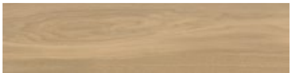
Natural ash beige 22,1 x 89 OP460-002-1