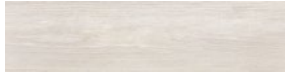
Nordic oak white 22,1 x 89

Przystosowane do ogrzewania podłogowego Floor heating ready