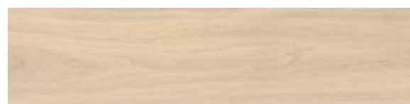
Natural ash cream 22,1 x 89